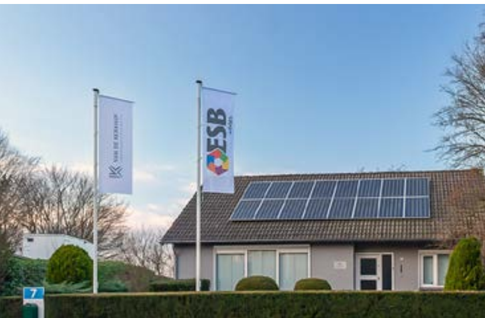
Deutersestraat 7 in 's-Hertogenbosch