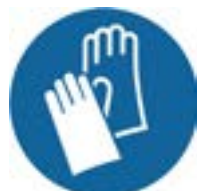
veiligheidshand- schoenen verplicht