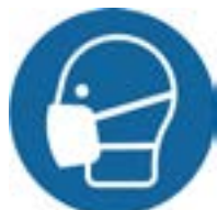
ademhalings- bescherming verplicht