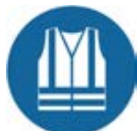
veiligheidsjas met verhoogde zicht- baarheid verplicht

Zorg ervoor dat je weet wat de verschillende symbolen betekenen en dat je de regels met betrekking tot het dragen van het PBM naleeft.