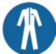
beschermende kleding verplicht