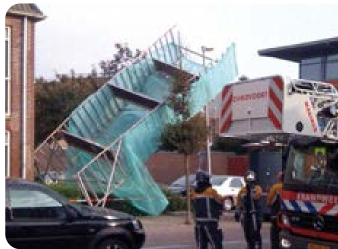
Figuur 2 | omgevallen rolsteiger

Een ongeval kan ook plaatsvinden zonder dat er iemand op de rolsteiger aan het werk is. Bijvoorbeeld door omvallende rolsteigers of doordat er voorwerpen tegenaan stoten of van de rolsteiger afvallen (denk aan gereedschap, rolsteigeronderdelen of bouwmaterialen).