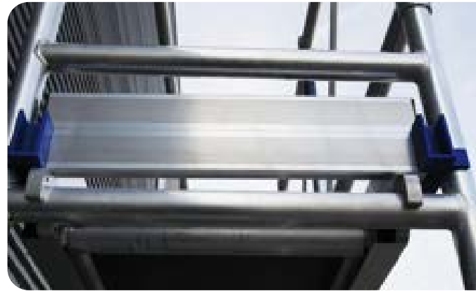
Figuur 6 | leuning en kantplanken