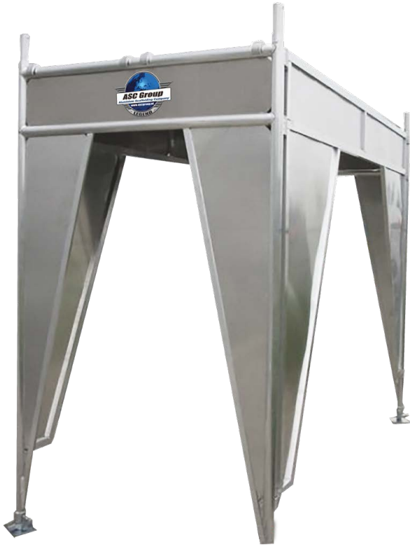
Figuur 7 | Inklimbeveiliging

Wij adviseren/bevelen aan in afwachting van de specifieke NEN 1004-3 voor rolsteigers onder de 2 meter platformhoogte (kamersteigers) de NEN 1004-1 te volgen.