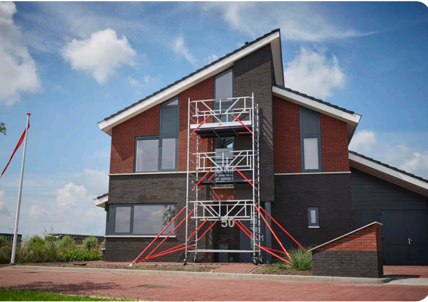
Figuur 1 | mobiele rolsteiger

Onder een rolsteiger verstaan we een mobiele steiger uitgerust met (zwenk)wielen en samengesteld uit geprefabriceerde onderdelen. Rolsteigers bevatten tussenvloeren en één of meerdere werkvloeren voor het uitvoeren van werkzaamheden op hoogte. Ze kunnen vrijstaand of tegen een gevel geplaatst zijn.