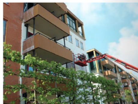
Er wordt vanuit meerdere hoogwerkers tegelijk gewerkt