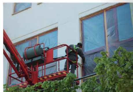
Alle buitengevels worden afgewerkt met Syllitol NQG