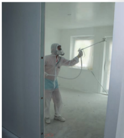
Binnen nemen de schilders van Van de Kerkhof in totaal ruim 50.000 vierkante meter onder handen